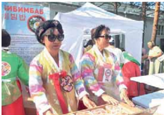
Фестиваль в Хабаровске (12+)