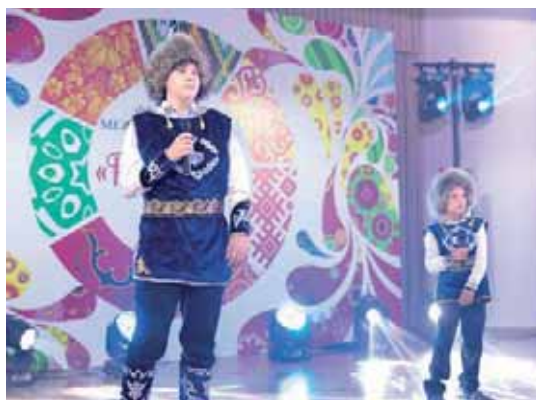
«Рябиновые бусы» (12+) в Уссурийске.

На фестиваль были приглашены официальные лица администрации Приморского края и Уссурийского