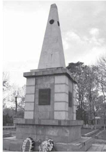
Погибшие в Маньчжурии и похороненные в Красино 658 наших бойцов и командиров.