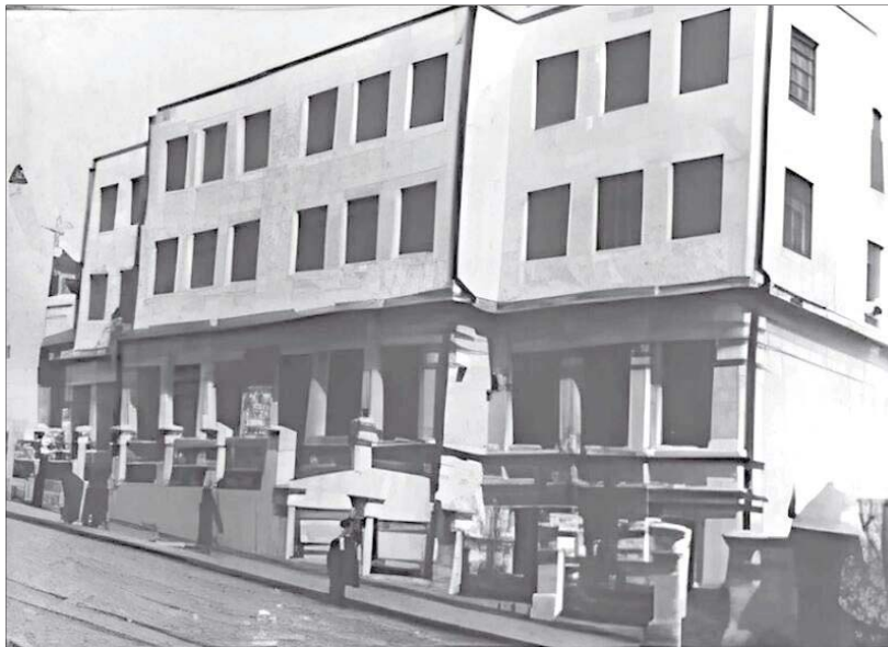
Дальневосточный корейский педагогический институт, 1937 год.