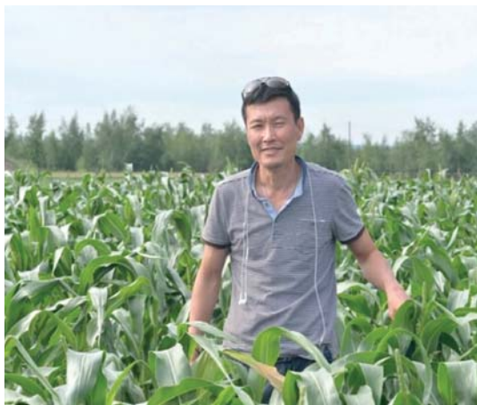
Семья Эм начинала с небольшого участка земли и одной теплицы.

Скандал с набегом на поля в Якутии закончился неожиданно