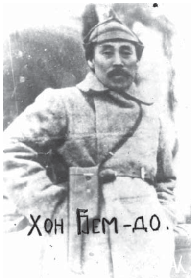
Корейский партизан Хон Бом До. Приморская область, 1921 г.