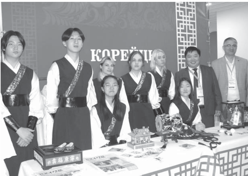
Уголок корейского культурного центра г. Уссурийска.

второй межрегиональной научно-практической конференции «Сохранение культурного наследия народов России: опыт и перспективы в региональном измерении» состоялась заседание круглого стола «Формирование механизма регулирования рынка внешней трудовой миграции – залог сохранения межнационального согласия в Приморском крае» и заседание Межнационального дискуссионного клуба «Диалог» на тему «Семья и ее роль в сохранении и развитии традиционных духовно-нравственных ценностей народов России».