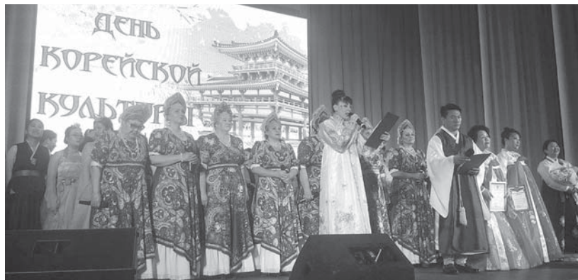
Большой концерт (6+) прошел в зале кинотеатра «Космос».

Ассоциация волгоградских корейцев планирует продолжить празднование 160-летия переселения корейцев в Россию в других районных центрах Волгоградской области.