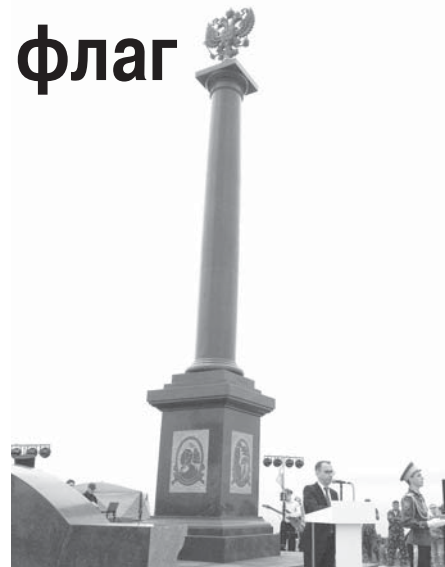
Памятная стела на мысе Андреева бухты Экспедиции.

Тем временем военный губернатор Восточной Сибири граф Николай Муравьев-Амурский лично обследовал окрестности гавани Посьета. Оценивая положение бухты Восточной, он назвал ее Новгородской - в прямой перспективе на возможность закладки здесь русского Ново Города. От-