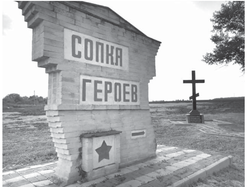
У Сопки Героев, Краснодарский край.